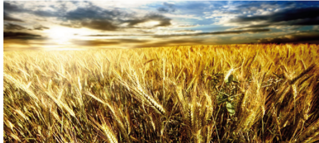
Fig. 3 - Frumento tenero: evoluzione del prezzo all'origine della granella (euro/t)

Confagricoltura ha fatto presente come gli incrementi, soprattutto per il grano duro, siano dovuti ad una situazione congiunturale internazionale, protrattasi nell'ultimo anno e mezzo, con costante diminuzione delle scorte, ma anche per i costi dei trasporti lievitati. Anche il prezzo all'ingrosso delle semole di frumento duro sta seguendo il medesimo andamento della materia prima; ciò in ragione della forte incidenza del prezzo della granella su quello della semola. Per quanto riguarda il comparto a tenero il mercato nazionale è caratterizzato da un andamento