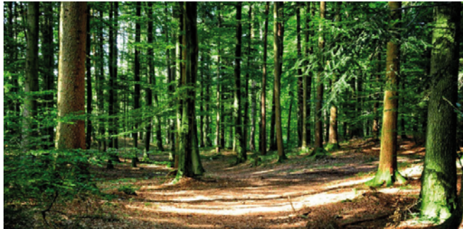
Le faggete della Foresta Umbra

I boschi, calcola l'inventario, coprono il 36,7% del territorio nazionale, i metri cubi di biomassa espressi in valori per ettaro sono passati da 144,9 a 165,4 metri cubi. Importanti i dati sulla quantità di Co2 sottratta all'atmosfera, che passa da 1.798 milioni di tonnellate a quota 2.088 milioni corrispondente a 569 milioni di tonnellate