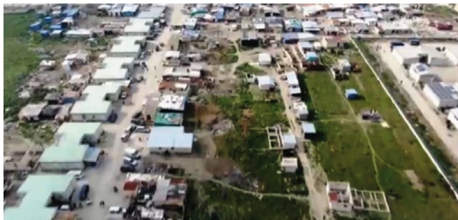
Il ghetto di Borgo Mezzanone