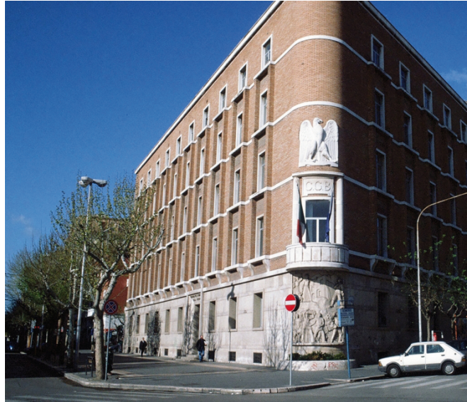
La sede dell'Ente in Corso Roma a Foggia

Il Consorzio di bonifica della Capitanata, da quasi cento anni sulla breccia, è il vero collante dell'agricoltura moderna nella provincia più agricola del Mezzogiorno. I numeri sono rilevanti: 440mila ettari di superficie agricola, 140mila ettari di superficie irri-