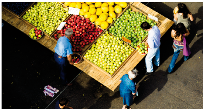
Mercato Rosati a Foggia

da 25 "Factory" selezionate con un avviso pubblico, che sono raggruppamenti di 255 soggetti pubblici e privati, tra cui Università, enti pubblici di ricerca, incubatori, acceleratori d'impresa, investitori, distretti produttivi e tecnologici, organismi formativi accreditati e Its. Di questi soggetti, 7 sono stranieri e 248 italiani di cui 124 pugliesi. La finalità dell'iniziativa di business matching è quella di realizzare incontri one-to-one di condivisione di bisogni e soluzioni innovative, che avverranno durante un evento online in programma il 16 dicembre. Il tutto finalizzato a sperimentare in concreto pratiche di open innovation, offrendo alle imprese la possibilità di esprimere i propri fabbisogni di innovazione, ai quali i Team possano rispondere con le loro idee e il know-how acquisito nel percorso di accompagnamento imprenditoriale, indicando soluzioni e applicazioni innovative.