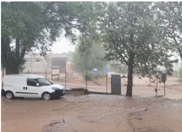
L'alluvione a San Marco in Lamis del luglio scorso