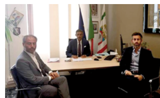
luglio. Il presidente di Confagricoltura Foggia

Confagricoltura ha chiesto alla Regione l'attivazione di «procedure immediate» per risarcire le aziende agricole del Gargano colpite dall'alluvione che si è abbattuta sul promontorio il 19