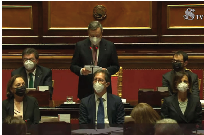
Il Governo Draghi

importante e fortemente innovativo del discorso di Draghi, ad avviso di Confagricoltura, è quello relativo alla protezione delle attività economiche che non possono essere tutte sostenute in modo indifferenziato. «Ci auguriamo - evidenzia Giansanti - che sia il primo passo verso una concentrazione degli incentivi e degli investimenti sulle imprese che hanno un futuro, perché producono per il mercato, danno lavoro e sono aperte alle innovazioni».