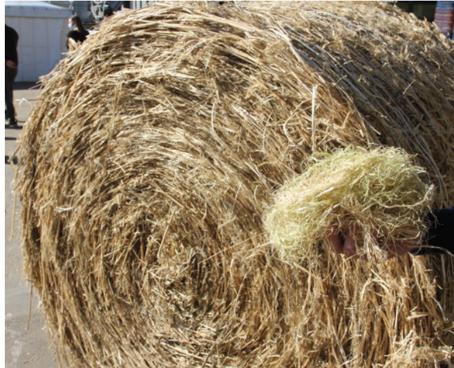
Una rotoballa a fibra di canapa

«La canapa torna ad essere una filiera agricola - dichiara L'Abbate - diamo in questo modo valore ai tanti operatori che stanno lavorando, non senza difficoltà, per ridare lustro ad un settore che ha visto l'Italia tra i maggiori produttori al mondo. Dopo l'approvazione della legge 242 del 2016, il settore della canapa ha finalmente un luogo dove poter discutere e affrontare le diverse problematiche e le questioni più