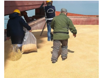
Controlli su nave di grano

influenzare, al ribasso, il prezzo del grano nostrano?". "Sono intollerabili - conclude Schiavone - le speculazioni a danno dei cerealicoltori, con ricadute penalizzanti anche sulla salute dei consumatori".