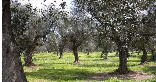
Patrimonio olivicolo da rifondare in Puglia

Un'opportunità per l'olivicoltura pugliese e anche foggiana, colpita duramente dalle gelate due anni fa, i 300 milioni per la rigenerazione olivicola finanziati per la Puglia. La Conferenza Stato-Regioni ha infatti dato il parere favorevole al Piano straordinario per la rigenerazione olivicola in Puglia, previsto con Decreto del Ministro delle Politiche agricole, Alimentari e Forestali, di concerto con i Ministri per il Sud e dello Sviluppo Economico. La ministra Teresa Bellanova aveva assunto questo impegno come prioritario. "Dopo il via libera della Conferenza Stato-Regioni - afferma infatti il ministro dell'Agricoltura - il Piano per la rigenerazione olivicola della Puglia, costruito insieme agli agricoltori e all'intero settore, è finalmente lo strumento operativo che territorio, agricoltori, imprese, cittadini, attendevano da tempo. Trecento milioni a disposizione dell'olivicoltura salentina e pugliese che attraverso una serie di misure hanno come obiettivo esplicito la ripresa e lo sviluppo di un segmento strategico dell'economia messo a dura prova dall'avanzare in questi anni del temibile batterio". "Per rigenerare l'olivicoltura e l'agricoltura - prosegue Bellanova - servono im-