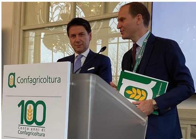
Due immagini del convegno di apertura delle celebrazioni del centenario di Confagricoltura, sotto il presidente Giansanti con il presidente del Consiglio Giuseppe Conte

governato il dopo-Brexit e rivista la politica agricola comune con adeguate risorse nel bilancio pluriennale. Quindi si è affrontata la questione dei dazi che frena l'export e richiede diplomazia e accordi bilaterali dell'Unione Europea. Il secondo talk show è stato dedicato all'agroalimentare al centro dell'economia nazionale. Si è parlato di cambiamenti climatici, sostenibilità, innovazione, semplificazione, telecomunicazioni e digitalizzazione del Paese, aggregazioni di