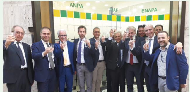
Brindisi per la nuova sede Enapa

Il patronato Enapa di Confagricoltura ha inaugurato la nuova sede in via della Repubblica 59/61 a Foggia. L'Enapa è il patronato della Confagricoltura per la tutela sociale a favore degli agricoltori, delle loro famiglie e di tutti i cittadini. Gli operatori esperti, i legali e i medici garantiscono un'attività di informazione, di assistenza e di tutela a quanti ne avessero bisogno. In particolare l'Enapa opera per il riconoscimento in Italia di tutte le prestazioni sociali (pensioni e rendite), quali, a titolo esemplificativo: pensioni di vecchiaia, invalidità, anzianità, inabilità, sociale, ai superstiti, nonché ricostituzioni, maggiorazioni e supplementi di pensione; infortuni e malattie professionali