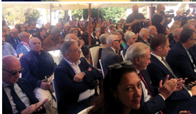
Due momenti del dibattito tenuto alle "Querce di Mamre"

invece abbiamo davanti a noi da combattere fenomeni atavici come il caporalato e la contraffazione dei prodotti agricoli che esportiamo in tutto il mondo".