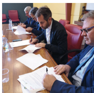
La firma dell'accordo

3 SOTTOSEGRETARI Il governo Conte "2" a trazione pugliese