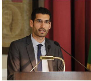
Il sottosegretario L'Abbate

M eno burocrazia, velocizzare le procedure per l'assunzione del personale e accedere a nuovi mercati. C'è molto da svecchiare nel tessuto agricolo ed economico del nostro paese e il governo ha preso precisi impegni in tal senso. Lo ha assicurato il neosottosegretario all'Agricoltura, Giuseppe L'Abbate, intervenendo a un convegno di Agrinsieme Puglia l'organismo che riunisce le federazioni regionali di Cia-Agricoltori italiani, Confagricoltura, Copagri e Alleanza delle Cooperative Agroalimentari. "Quella della distribuzione del valore è una questione che va affrontata intervenendo su alcune linee direttrici: riducendo i costi; chiudendo le singole filiere; avviando i piani di settore; contrastando contraffazioni e frodi; lavorando su infrastrutture e reti", ha spiegato L'Abbate. Il Sottosegretario, recependo le istanze di Agrinsieme, ha assicurato il suo impegno per "riprendere il lavoro sul decreto semplificazione, per poterlo approvare entro fine anno e andare a sburocratizzare una serie di gravosi adempimenti ai quali sono sottoposte le imprese, come ad esempio quelli relativi alle visite mediche dei lavoratori stagionali". Al confronto ha preso parte anche il presidente della Regione, Michele Emiliano, che com'è noto agli agricoltori ha da qualche mese anche la delega