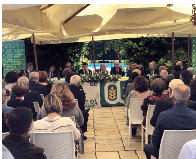
Il dibattito su domanda-offerta promosso da Anpa Confagricoltura