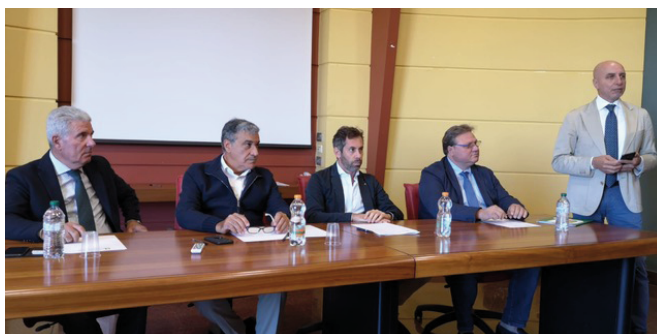
La presentazione del contratto di filiera in Confagricoltura