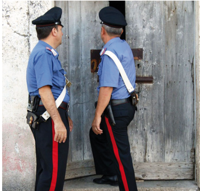
Controlli dei carabinieri in un casolare di campagna

Confidiamo che l'ottimo lavoro della Procura produca ulteriormente un effetto dissuasivo di tali comportamenti, prendiamo con forza le