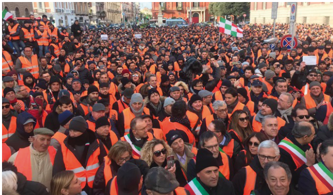
Le manifestazioni degli agricoltori lo scorso inverno

Per il territorio pugliese si tratta di un atto importante che risponde alle sollecitazioni e alle battaglie portate avanti in questi mesi da Confagricoltura, a livello territoriale e nazionale. Ci sono anche i territori di Cerignola, Stornara, Stornarella, Carpino e Ischitella oltre a San Ferdinando di Puglia e Trinitapoli nella Bat nel decreto di declaratoria per le eccezionali avversità atmosferiche (le gelate) verificatesi in Puglia dal 26 febbraio al 1° marzo 2018. In particolare, per favorire la ripresa economica e produttiva delle imprese agricole, il decreto prevede la possibilità che possano essere concessi «contributi in conto capitale fino all'80% del danno accertato sulla base della